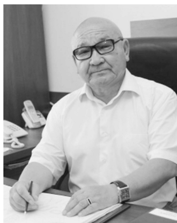
специалистов займётся Минздрав Калмыкии.